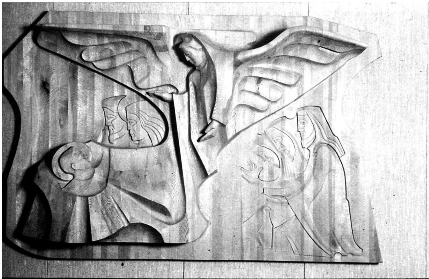
"Jouluyön ihme" Laurilan seurakuntakodissa. Muistikuva enkelin vierailusta on ikuistettu reliefiin.