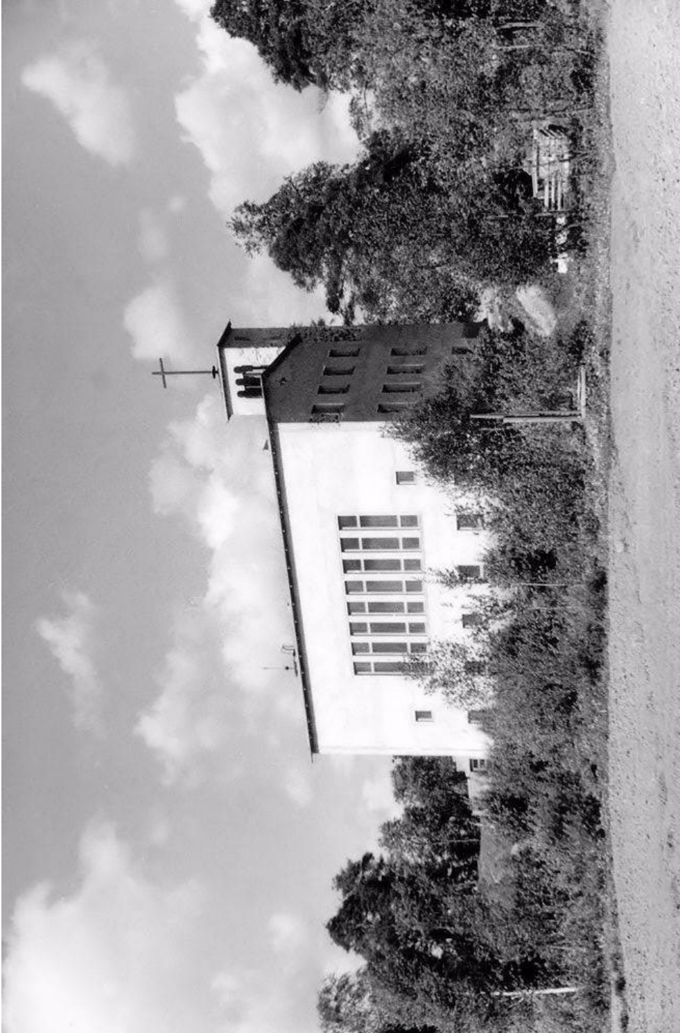
kuva 9.6.1945 / Pekka Harjuvaara / Jaakko Harjuvaara

mahtui n 300 henkilöä. Viereisellä koululla oli suuret kristilliset teinipäivät ja osanottajien piti jättää päällysvaatteet koululle, jotta penkit voitiin täyttää mahdollisimman tiiviisti. Lehterille nousivat portaat kirkon pohjoisesta ulkopäädystä sekä pääoven vierestä ylös, molemmat ovat nykyisin käytössä. Seurakuntatalon remontin yhteydessä uuden kirkon rakentamisen jälkeen salin sisäkattoa laskettiin alemmaksi, niin että lehtereiden luukut jäivät piiloon kokonaan ja nykyisin siellä on etuseinän kohdalla pienoisrautatiekerhon tila, sivussa käytävä- ja kaappitilaa ja takaosassa kokous/kerhohuone