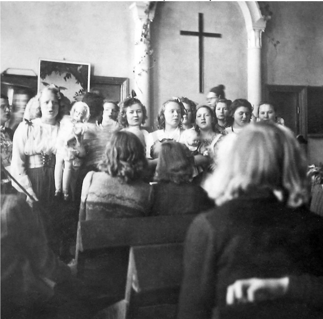
Kuva 1947 penkkareista, Pentti Tynkkysen albumista

Vanhaa kirkkoa käytettiin myös viereisen Yhteiskoulun tilapäisinä LUOKKATILOINA. Esimerkiksi takaosan lehteriä ja seurakuntasalia taasen luonnonhistorian salina. Seuraavalla sivulla on kuva, kun kesken luonnonhistorian tunnin abit tulivat laulamaan penkkarilaulujaan tähänkin luokkaan.