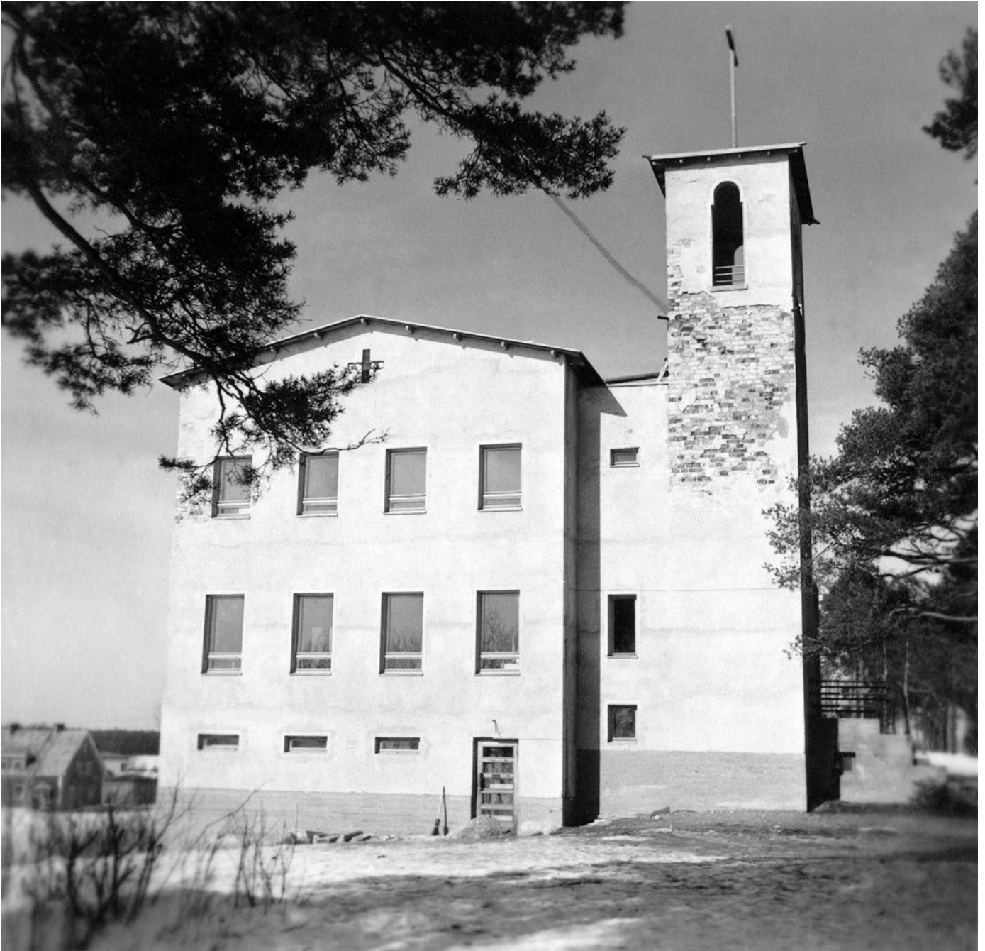
Kuva 24.3.1945